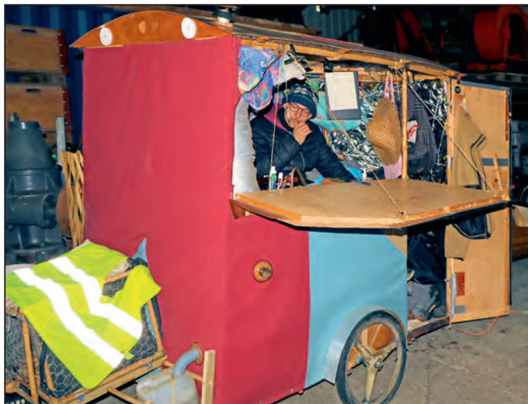
Une roulotte improbable