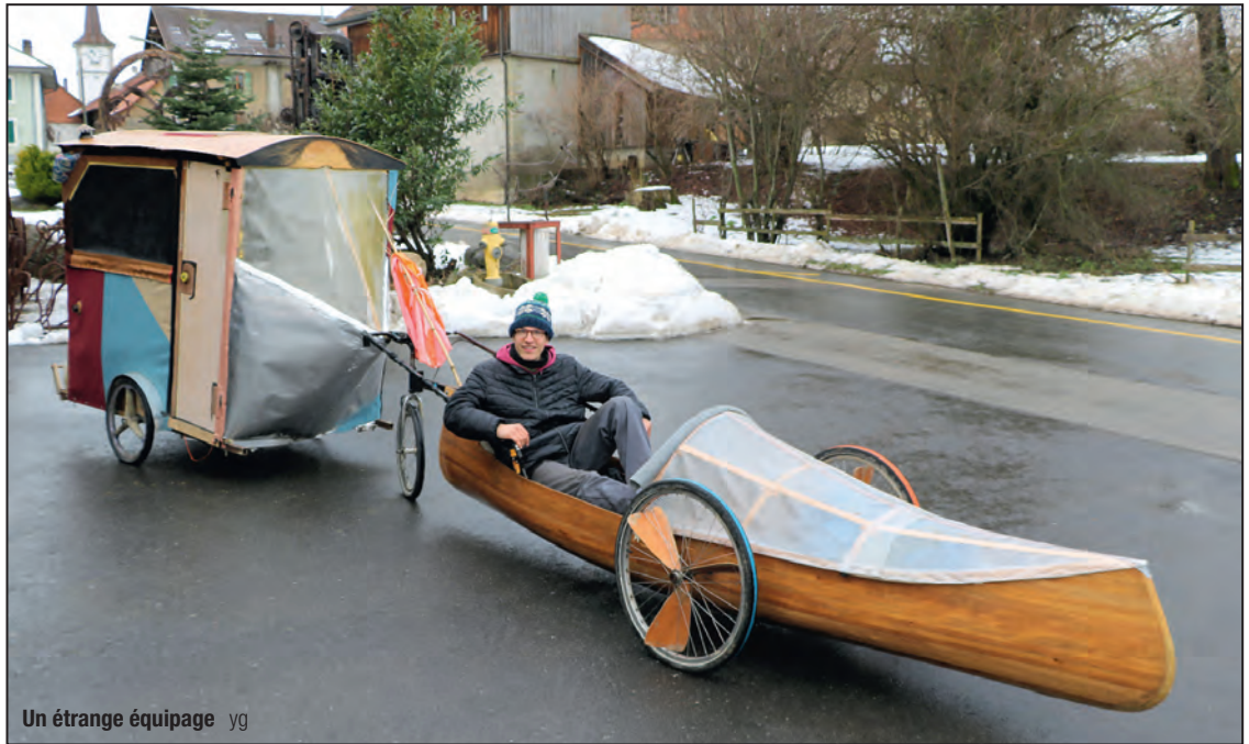
Un étrange équipage yg

Mais revenons à son ahurissant moyen de locomotion. Celui-ci se compose d'un long kayak en bois, muni de roues actionnées par un pédalier via un dispositif similaire à un vélo. Ce curieux engin est com-