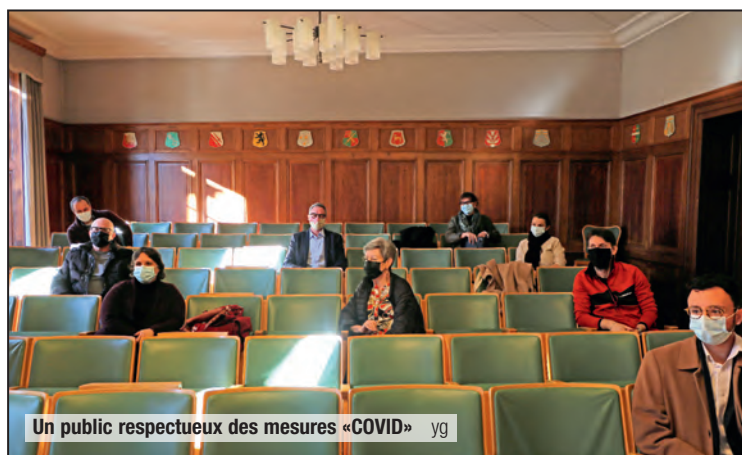
Un public respectueux des mesures «COVID» yg