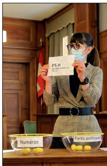
Un joli minois et une main innocente yg