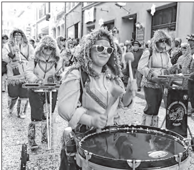
Souvenirs... souvenirs... de 2019