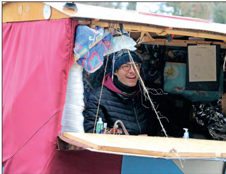
Un joyeux poète