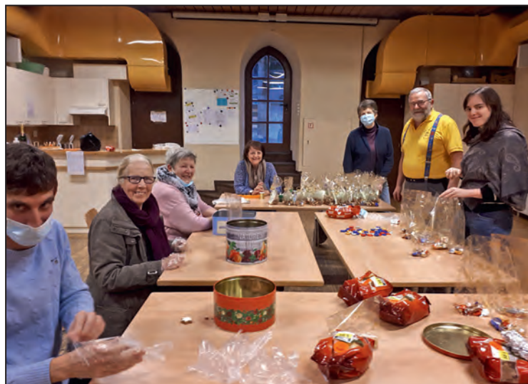
Le Conseil au travail