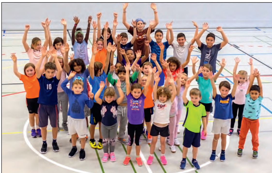
Le mouvement Kids du HC Moudon poursuit ses activités malgré la pandémie. Joie et bonheur des enfants sont au rendez-vous! ca

A la rentrée d'août, toutes les équipes ont pu reprendre les entraînements. Même le championnat a pu débuter. On y croyait. Actifs, juniors, tout le monde se retrouvait autour de notre ballon, de notre sport, dans notre magnifique salle. On était heureux... c'était sans compter la deuxième vague. A partir d'octobre, c'était pratiquement un retour à la case départ... plus de championnat, plus d'entraînement pour les actifs... mais un espoir dans la possibilité offerte par les autorités de continuer le sport des enfants de moins de 16 ans. Possibilité que nous avons immédiatement exploitée, poursuivant les entraînements de nos trois groupes de Kids (moins de 7 ans, moins de 9 ans et moins de 11 ans), ainsi que des équipes de handballeurs de moins de 13 ans (M13) et moins de 15 ans (M15). A ce moment, il semblait en effet essentiel pour le staff technique de pouvoir continuer à offrir à ces enfants des espaces où se dépenser, qui plus est en pratiquant leur sport favori. Nos juniors de 12 à 16 ans ont d'ailleurs prouvé que cette initiative répondait à une réelle attente, puisque lorsque la question s'est posée de jouer masqué ou d'interrompre les entraînements, à l'unanimité, les équipes ont décidé de porter le masque pendant les deux à quatre heures d'entraîne-