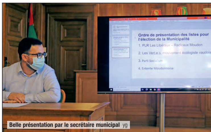
Belle présentation par le secrétaire municipal yg