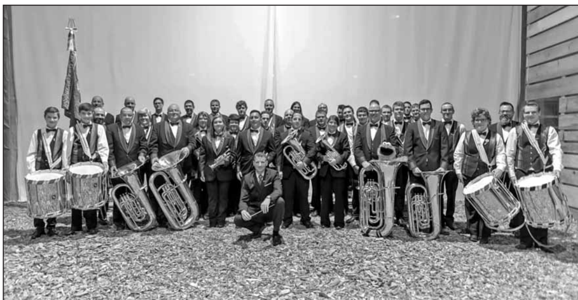
La Fanfare du Jorat à la Cantonale 2018

Pour bien commencer ces moments musicaux, une partie «festin» est proposée comme à l'habitude. Il faut bien sûr réserver sa