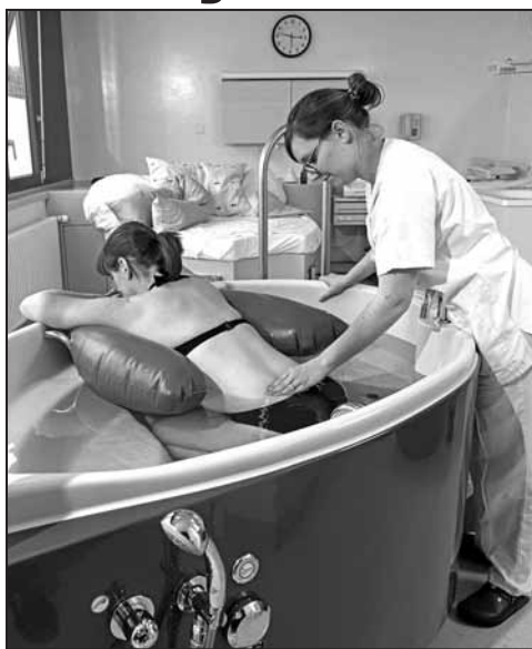
La salle physiologique

La maternité de l'HIB a terminé 2018 avec une activité soutenue: 614 bébés y sont nés. C'est la deuxième année consécutive que la maternité franchit ainsi la barre symbolique des 600 nouveau-nés. Le registre des naissances broyardes 2019 a été inauguré le 2 janvier à 14h40 par la