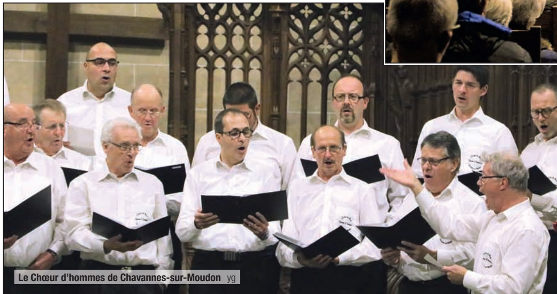
Le Chœur d'hommes de Chavannes-sur-Moudon yg

bien-être, de plaisir et d'allégresse. Lorsqu'on se retrouve en nombre, lors d'un concert, cet effet est encore plus saisissant: que du bonheur! Ajoutons que pour ce moment