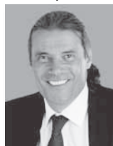
Oskar Freysinger Ancien Conseiller d'Etat