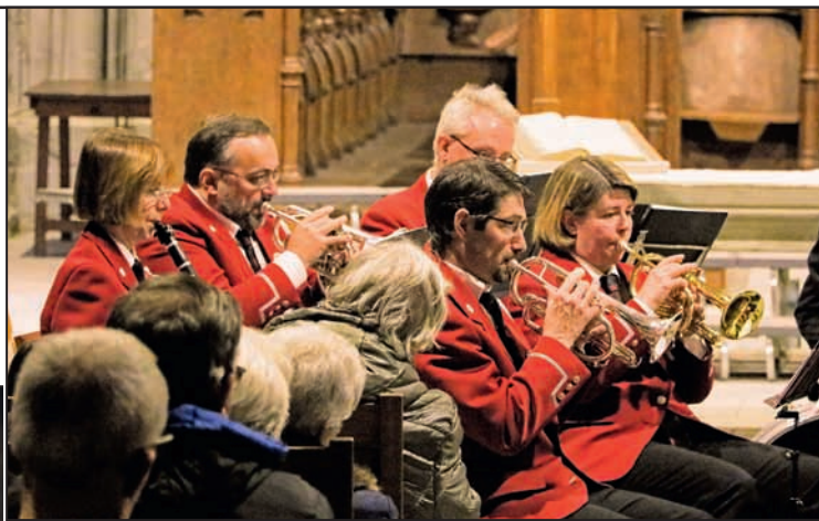
Une partie de l'Instrum en action