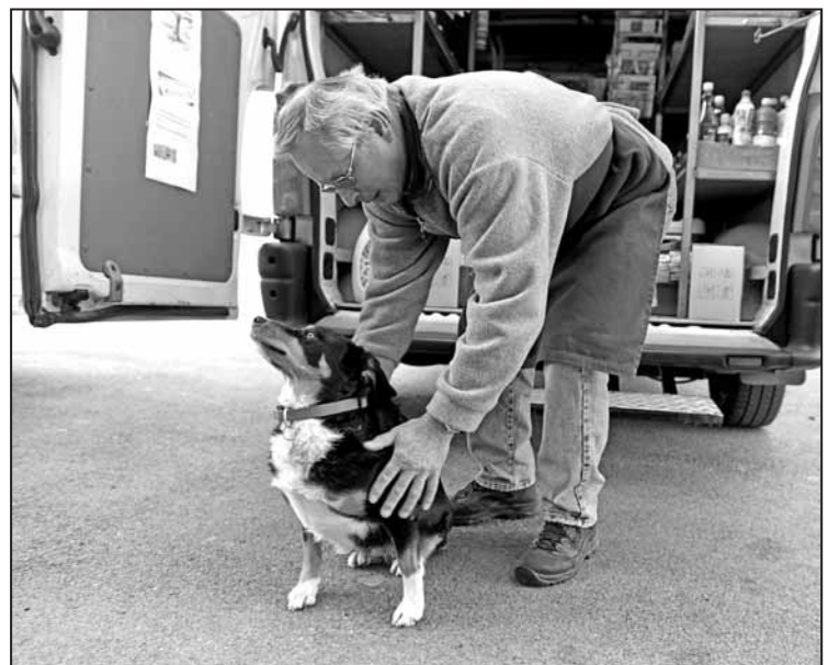
Baya sait que ses croquettes viennent d'arriver