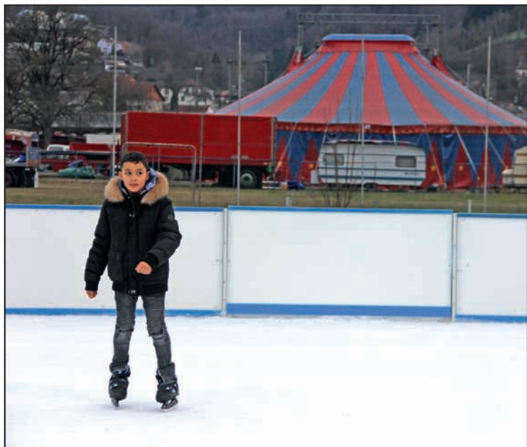
Les écoliers sont heureux de rechausser leurs patins

Lundi-mardi-jeudi-ven. 16h30-19h00 Mercredi 14h00-19h00 Samedi, dimanche et jours fériés 11h00-19h00 Vacances scolaires VD 11h00-19h00