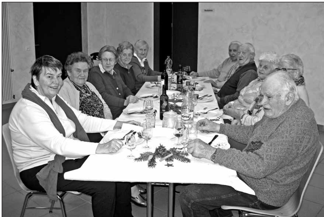
Des participants satisfaits