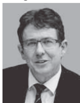
Albert Rösti Conseiller national Président UDC Suisse